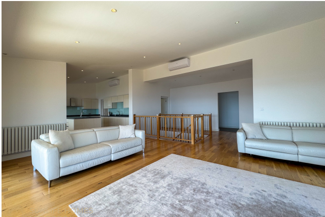
Villa Costa d'en Blanes