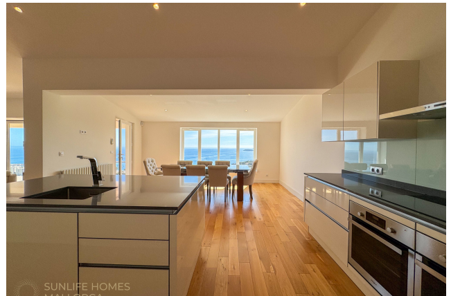
Villa Costa d'en Blanes