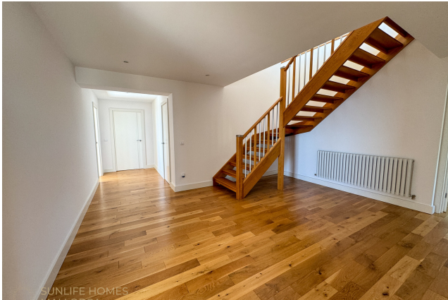
Villa Costa d'en Blanes