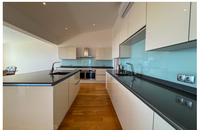
Villa Costa d'en Blanes