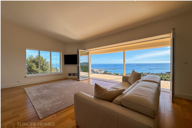
Villa Costa d'en Blanes