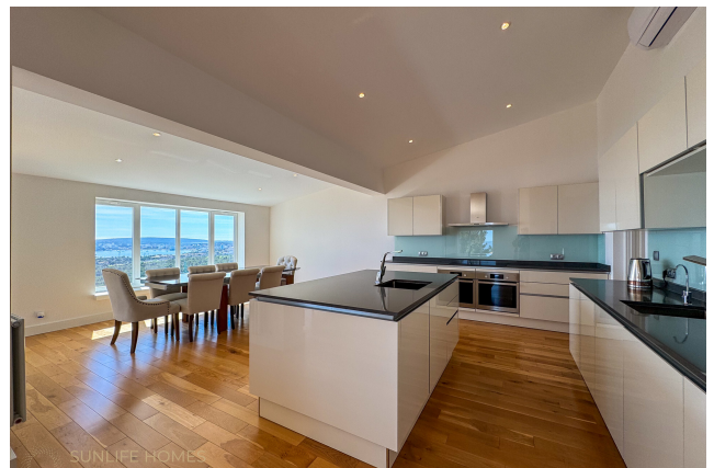
Villa Costa d'en Blanes