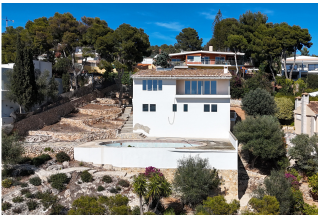
Villa Costa d'en Blanes