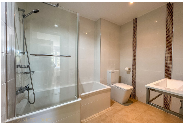
Villa Costa d'en Blanes