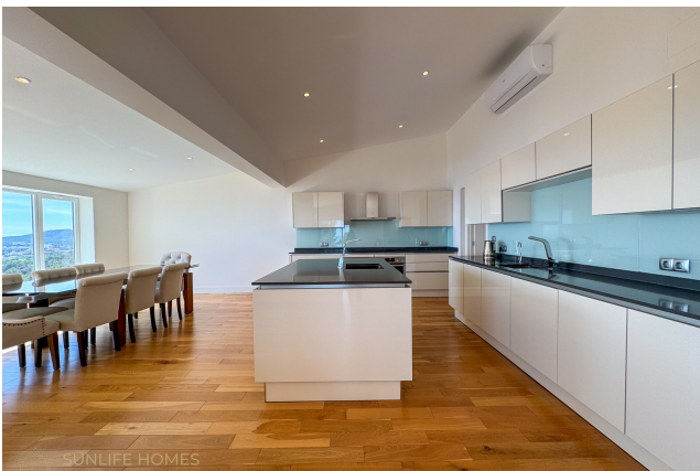
Villa Costa d'en Blanes