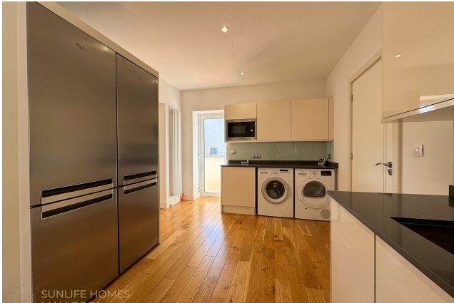
Villa Costa d'en Blanes