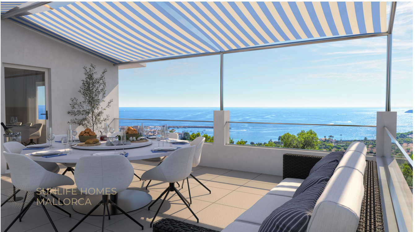
Terrace plans Rendeirng