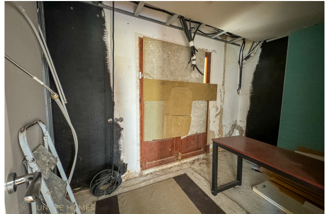
Villa Costa d'en Blanes