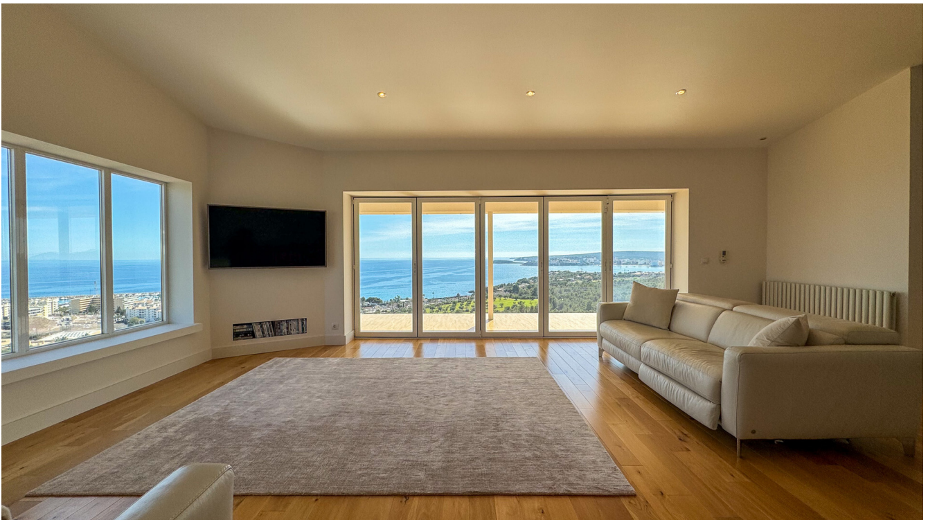
Villa Costa d'en Blanes