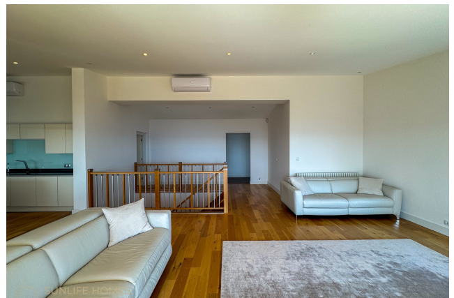
Villa Costa d'en Blanes