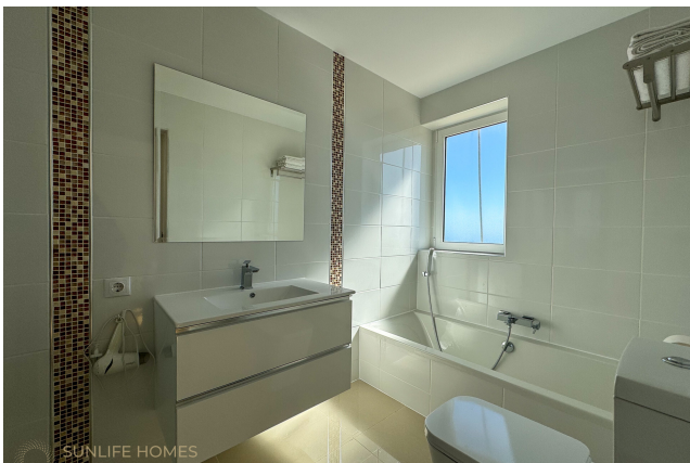
Villa Costa d'en Blanes