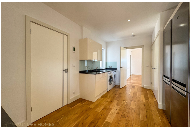
Villa Costa d'en Blanes