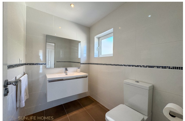
Villa Costa d'en Blanes