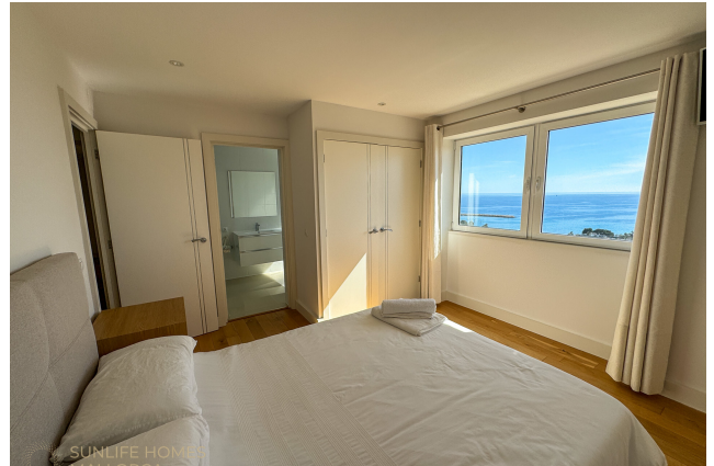
Villa Costa d'en Blanes