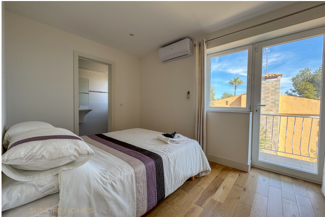
Villa Costa d'en Blanes