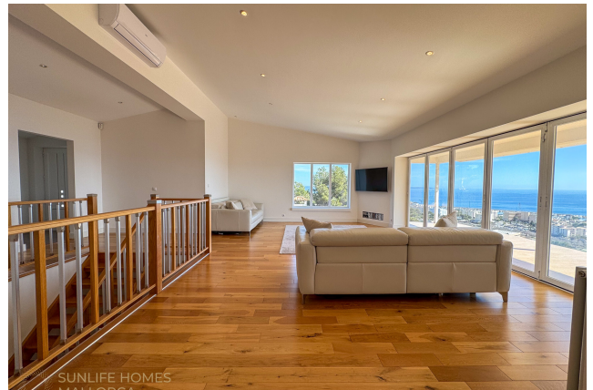
Villa Costa d'en Blanes