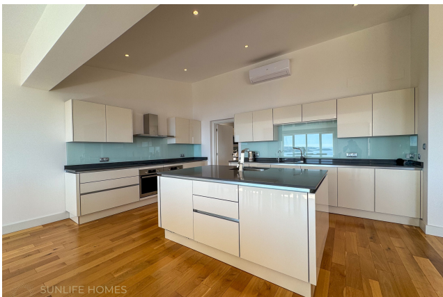
Villa Costa d'en Blanes