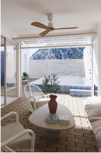
Casa pueblo Pollença