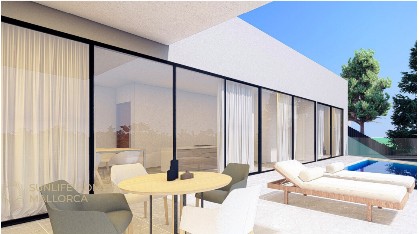
Terraza soleada con amplio espacio para vivir al aire libre