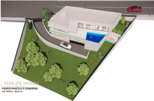
Plano 3D con vista de cubierta y parcela