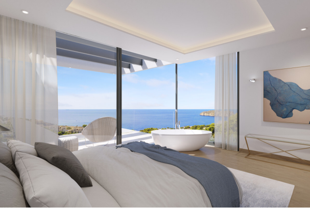
Villa Santa Ponsa