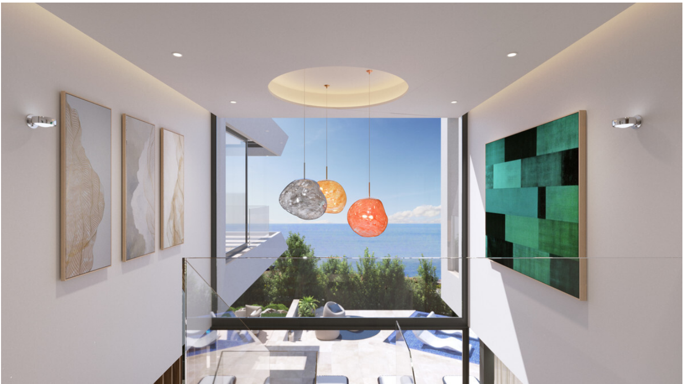
Villa Santa Ponsa