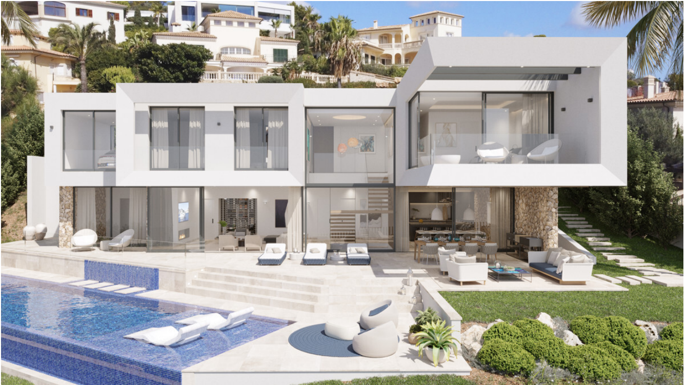
Villa Santa Ponsa