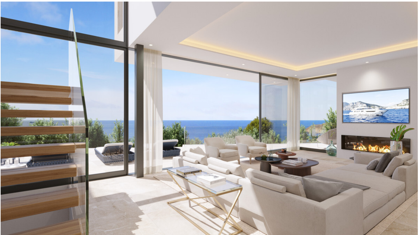
Villa Santa Ponsa