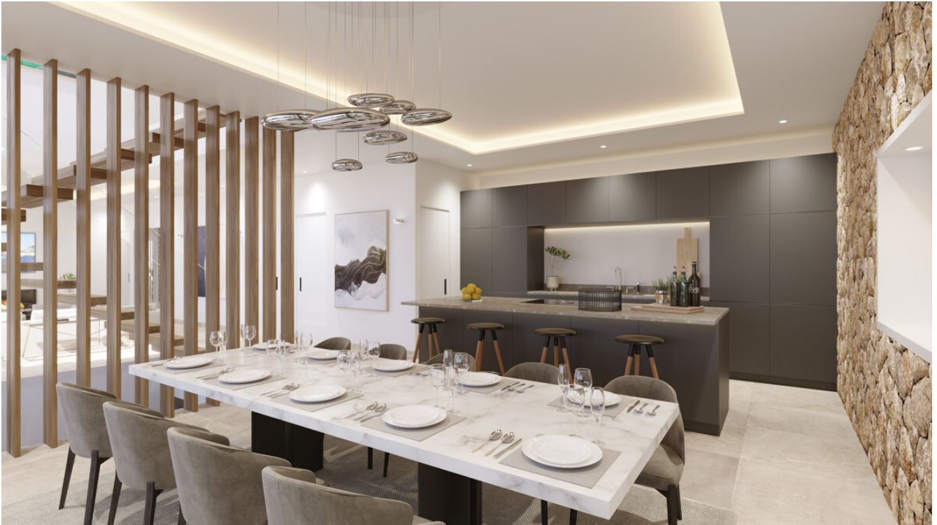
Villa Santa Ponsa