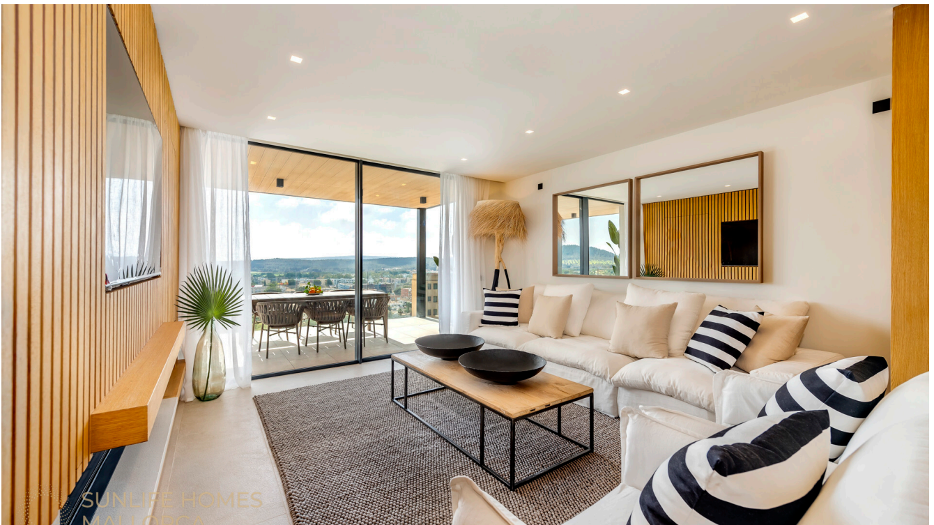
Apartment mit hochwertiger Ausstattung