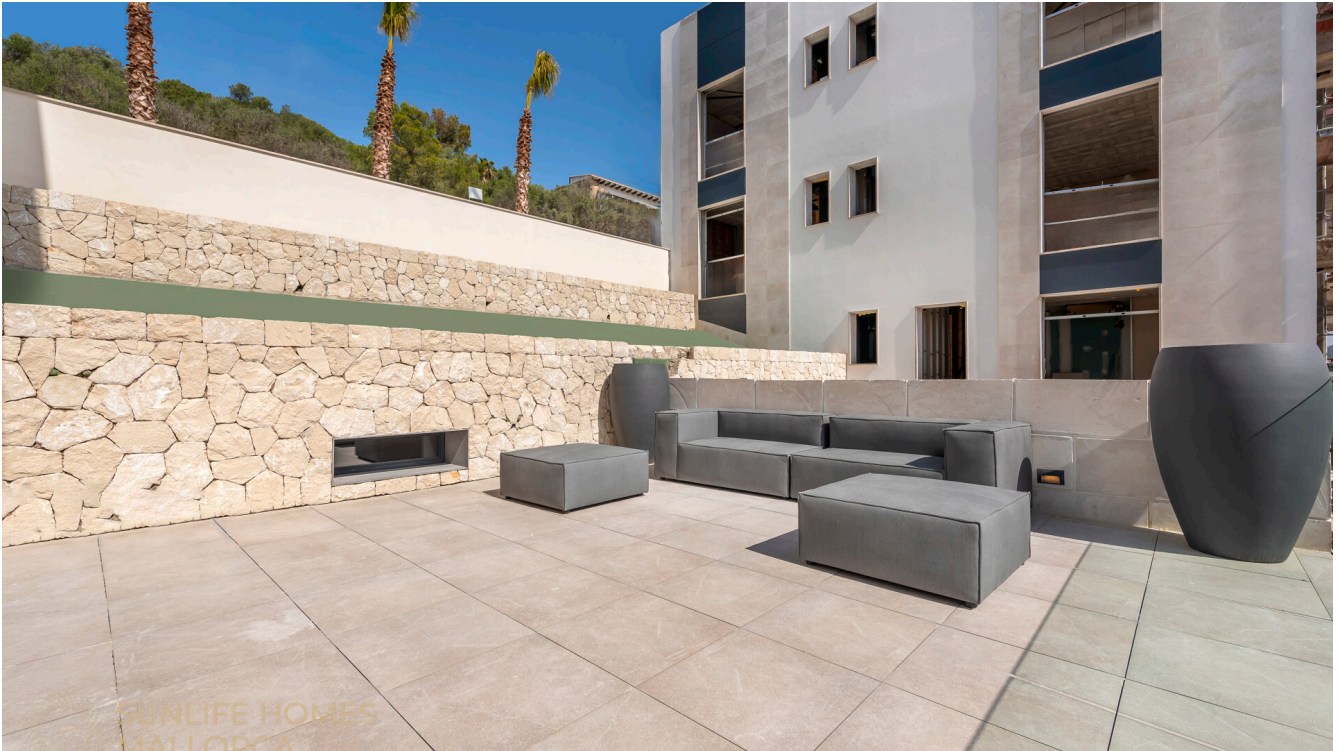
Apartment – Mallorca