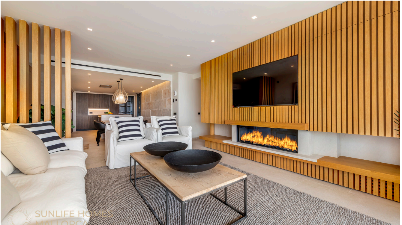
Apartment mit hochwertiger Ausstattung