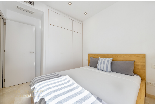
Zweites Schlafzimmer ideal für Gäste oder Familie