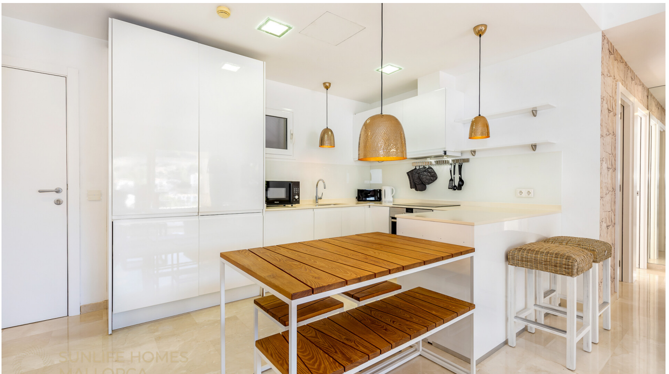
Offener Küchen und Essbereich