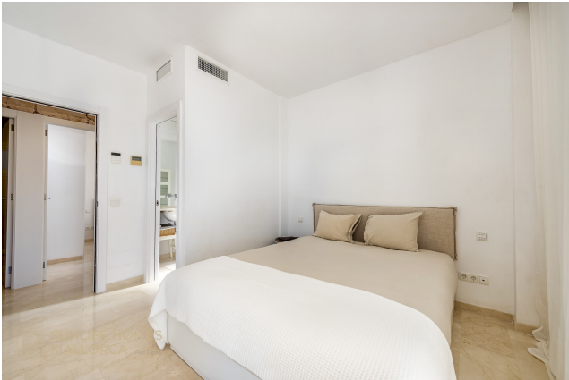
Master Suite mit Einbauschränken