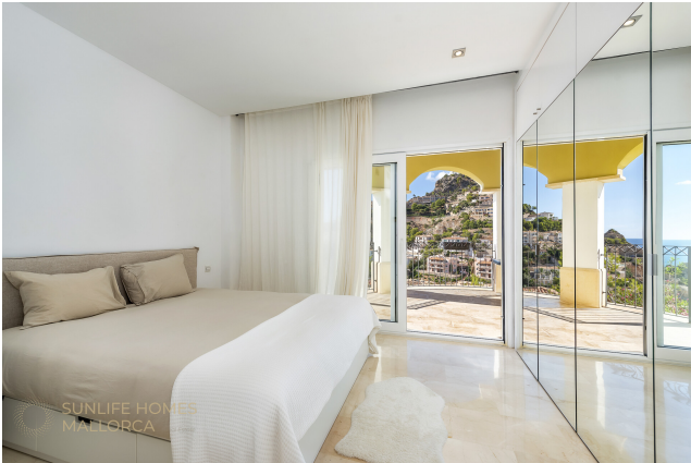
Großzügiges Master Schlafzimmer mit ruhiger Atmosphäre