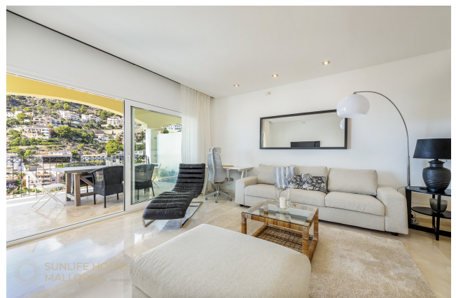
Wohnbereich mit viel Tageslicht und Zugang zum Außenbereich