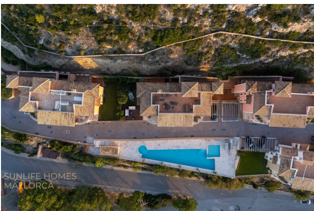
Überblick über die exklusive Wohnanlage mit Poolbereich