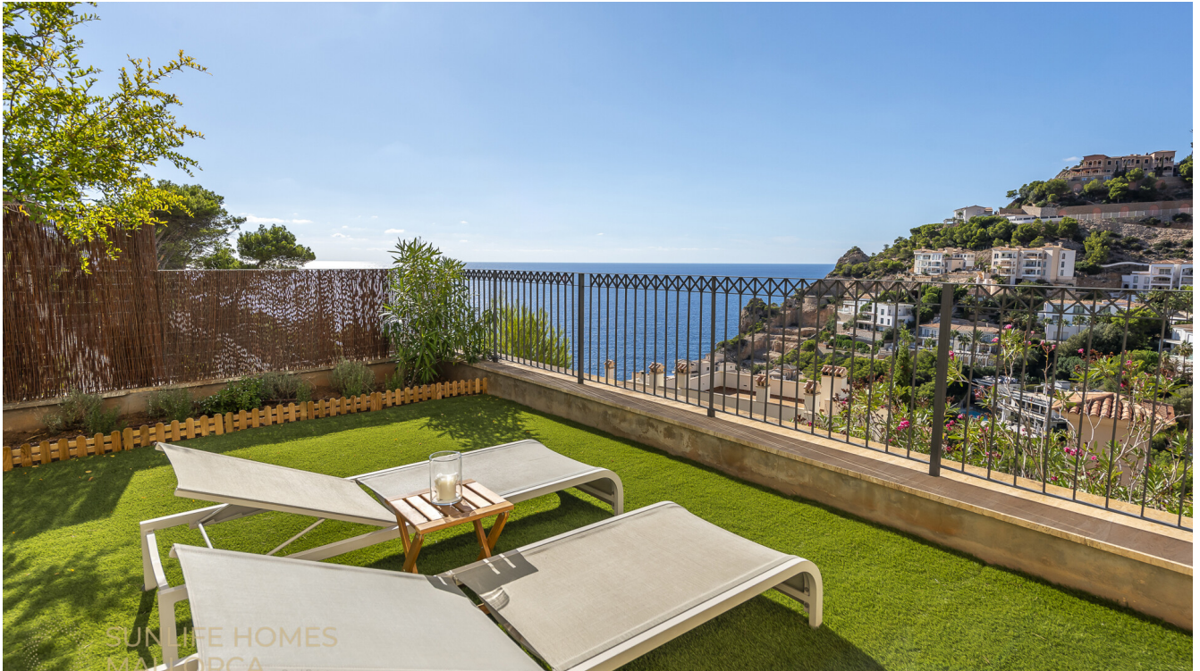
Privater Garten mit Meerblick und mediterranem Ambiente