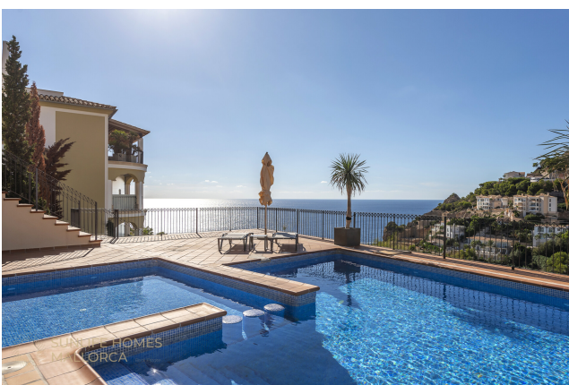
Gepflegter Gemeinschaftspool mit Whirlpool in exklusiver Anlage