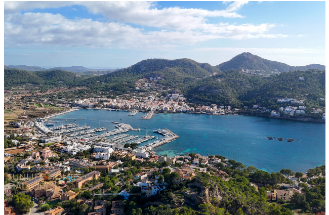
Port Andratx und die umliegende Küstenlandschaft