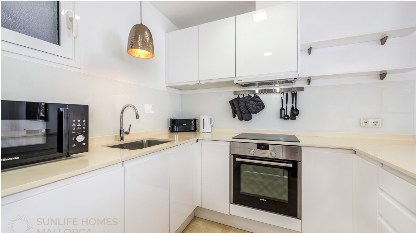
Moderne, voll ausgestattete Küche