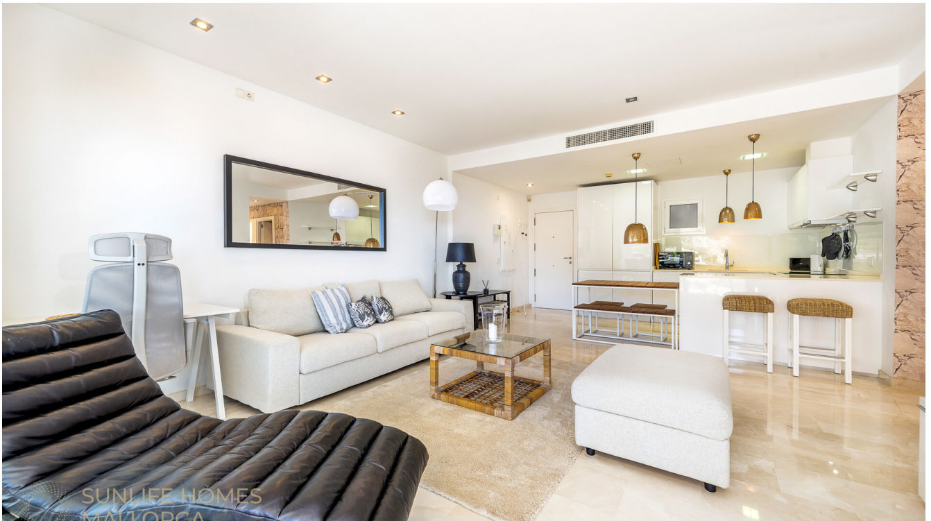
Heller Wohn und Essbereich mit direktem Zugang zur Terrasse