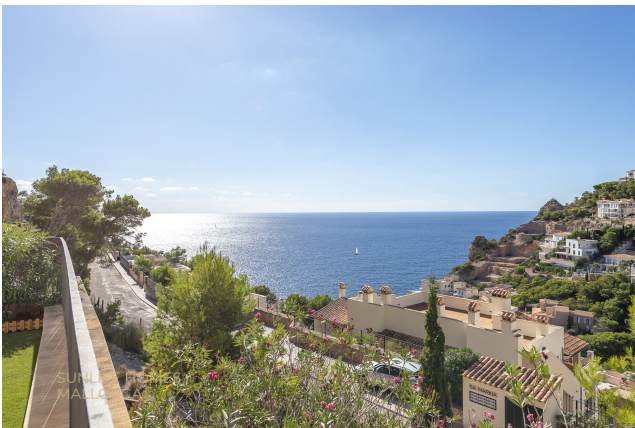
Weitläufiger Meerblick über die Bucht von Port Andratx