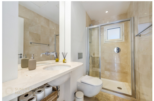
Zweites Badezimmer mit Dusche