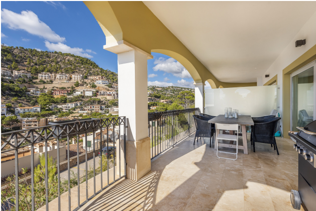
Terrasse mit Outdoor Möbeln und gemütlichem Sitzbereich