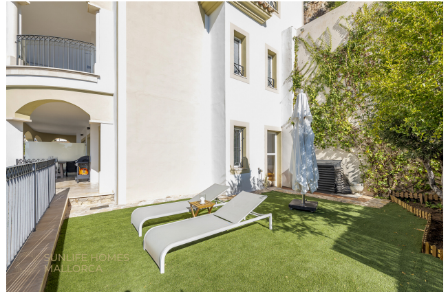
Garten mit mediterraner Bepflanzung