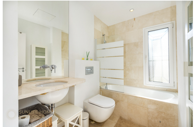
Master Badezimmer mit Badewanne und Fenster