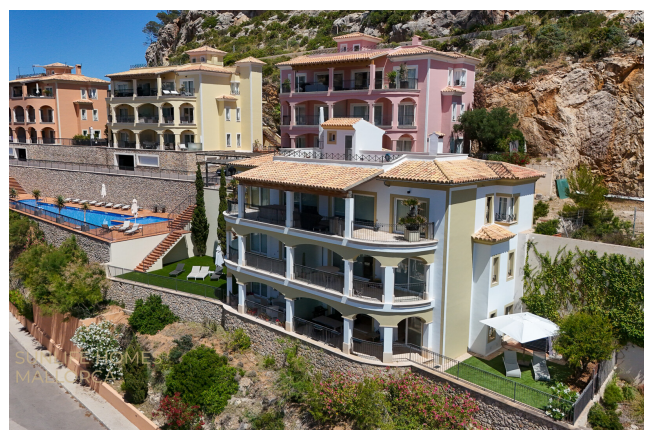
Gepflegte Wohnanlage in begehrter Lage von Port Andratx