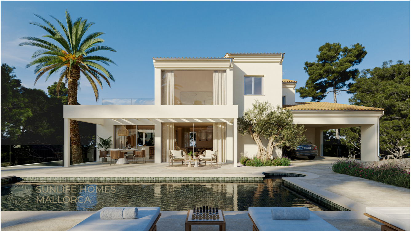
Villa Santa Ponsa