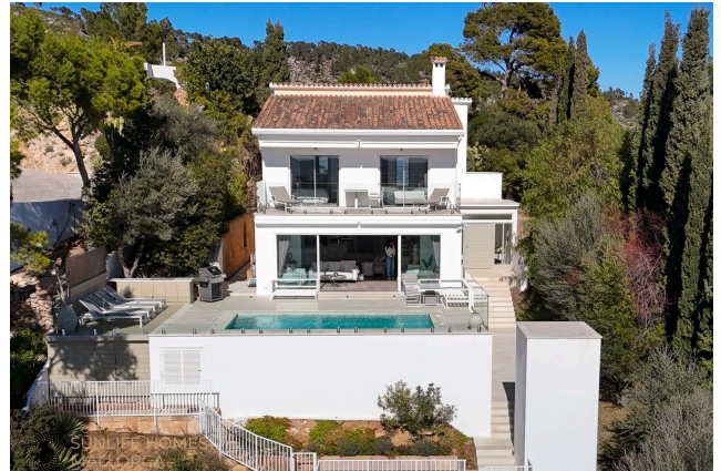
Villa Costa den Blanes