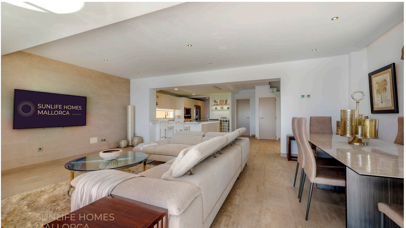
Villa Costa den Blanes