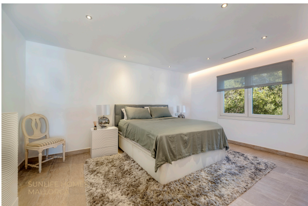
Villa Costa den Blanes