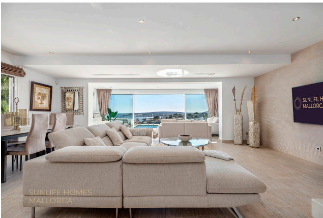
Villa Costa den Blanes