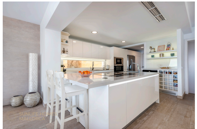
Villa Costa den Blanes