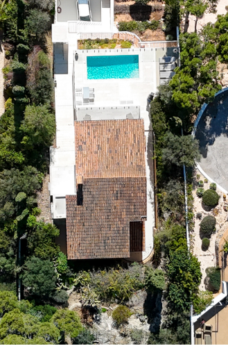
Villa Costa den Blanes