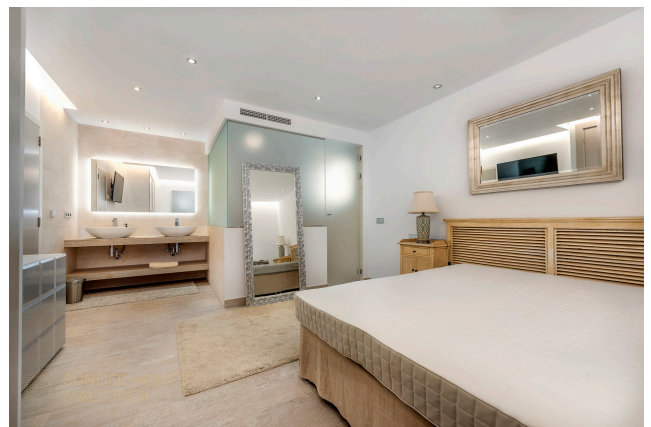
Villa Costa den Blanes