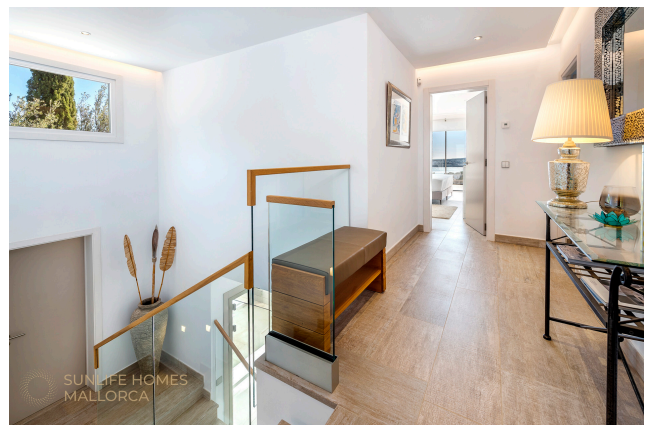
Villa Costa den Blanes