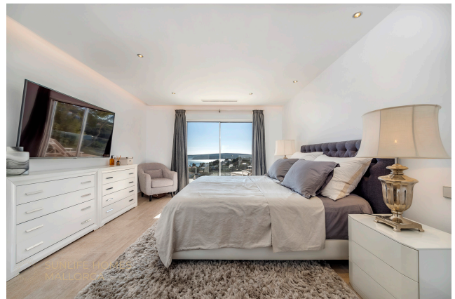
Villa Costa den Blanes