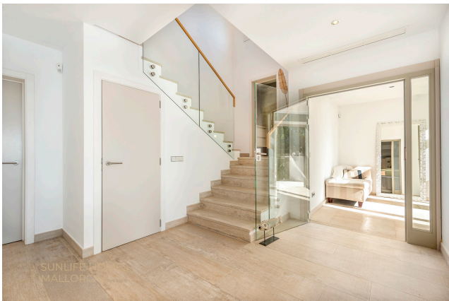
Villa Costa den Blanes