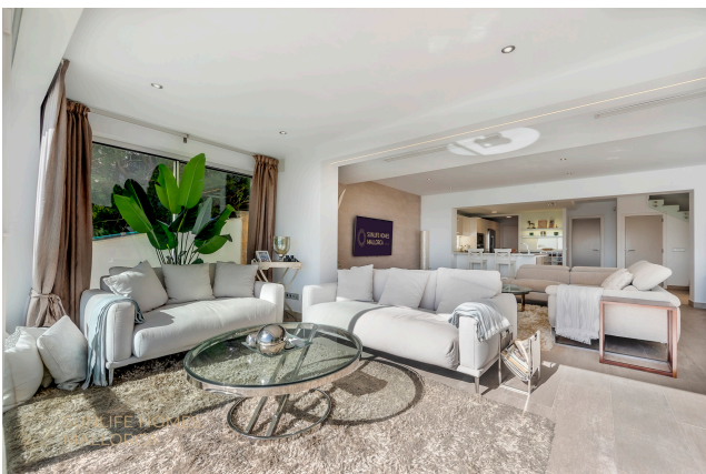
Villa Costa den Blanes