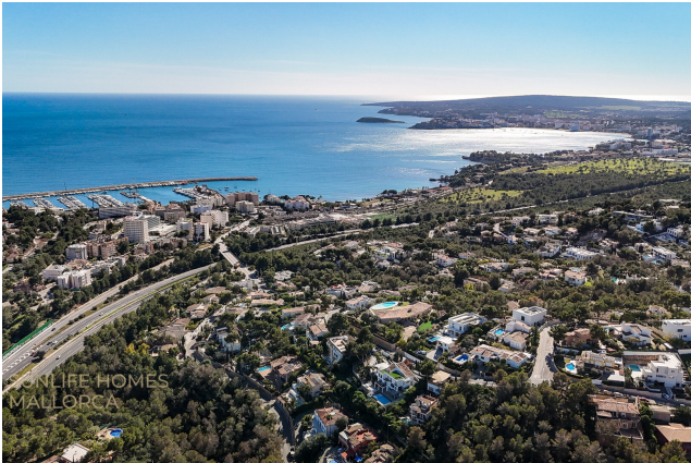
Villa Costa den Blanes