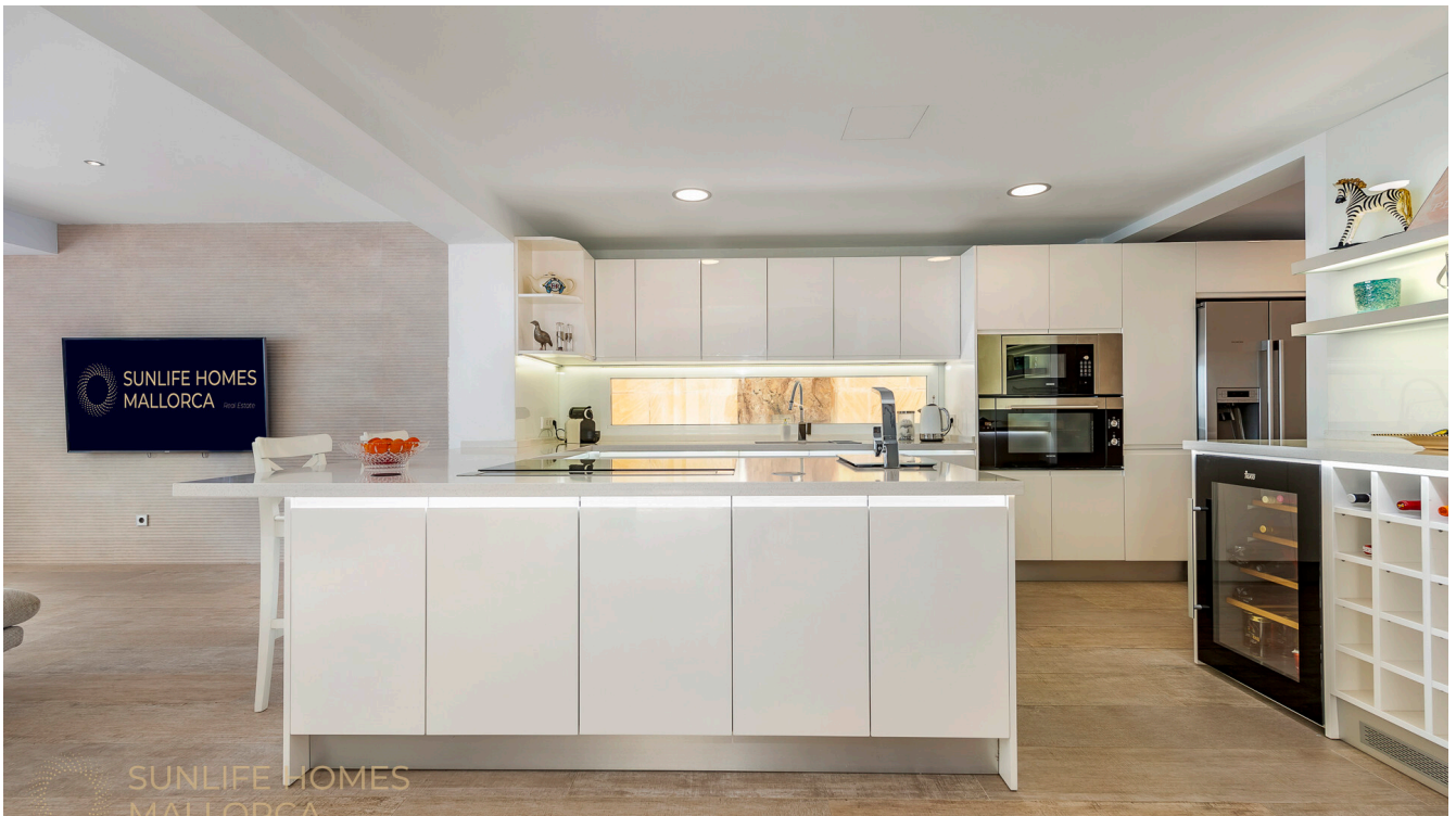
Villa Costa den Blanes