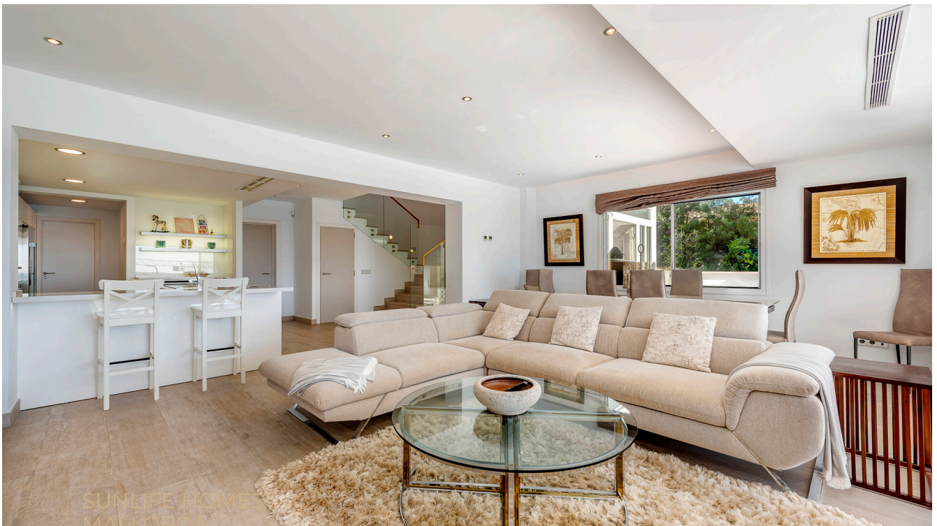
Villa Costa den Blanes