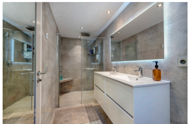
Villa Costa den Blanes