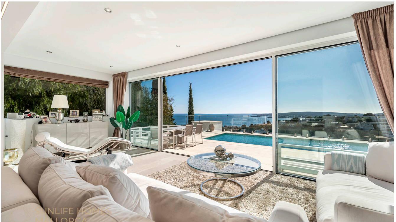
Villa Costa den Blanes