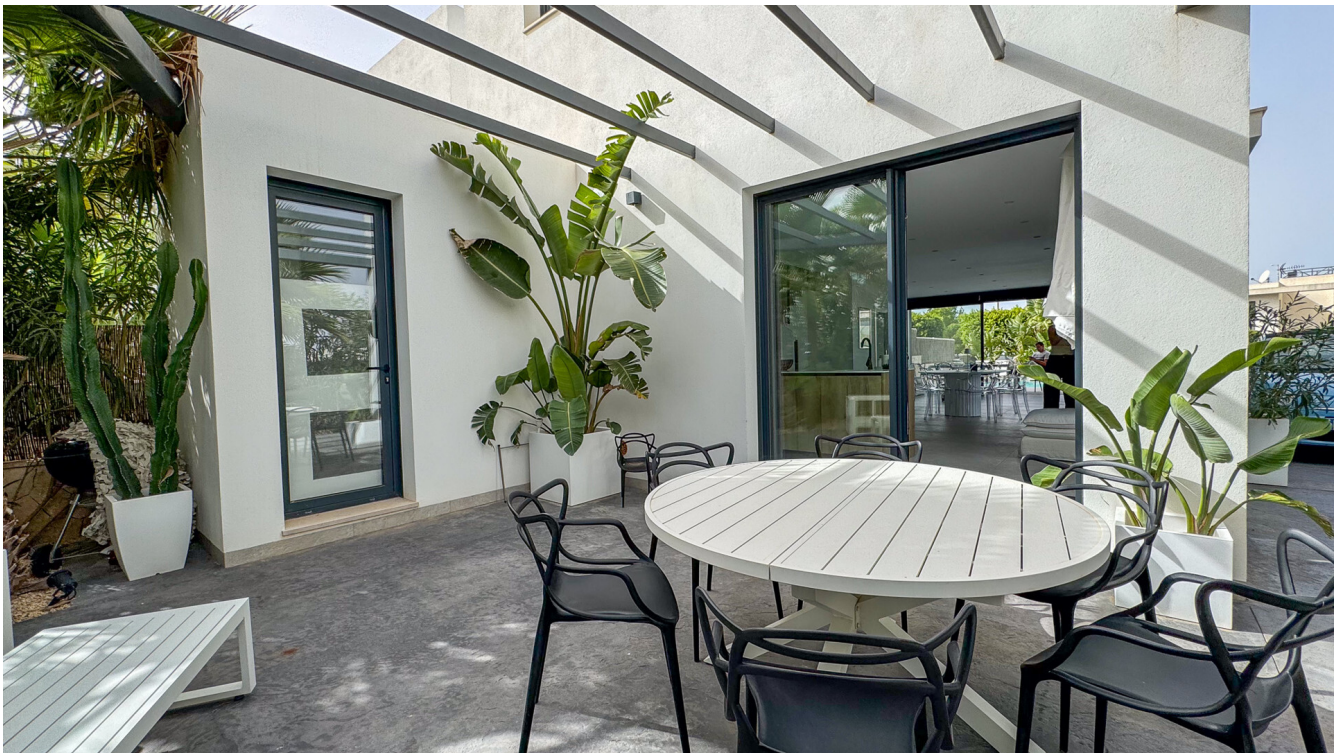
Villa Puig de Rós