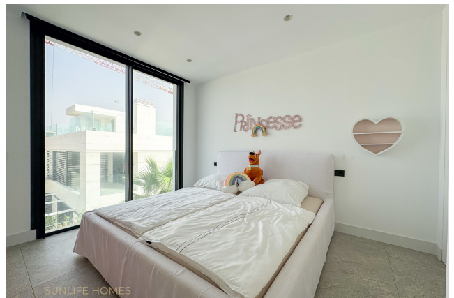
Villa Puig de Rós