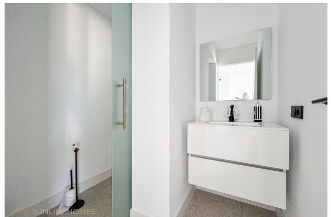
Villa Puig de Rós