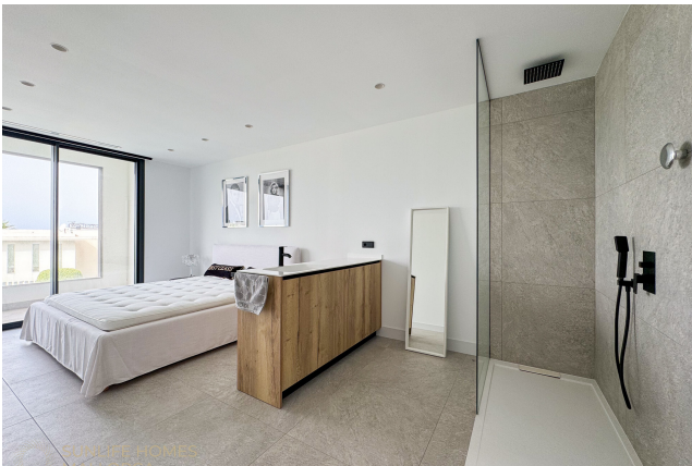
Villa Puig de Rós