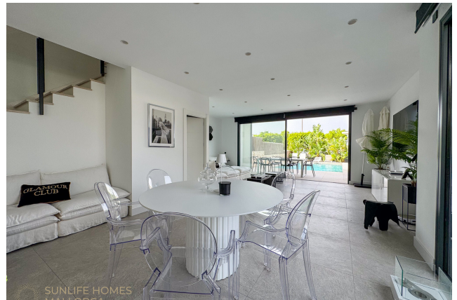
Villa Puig de Rós