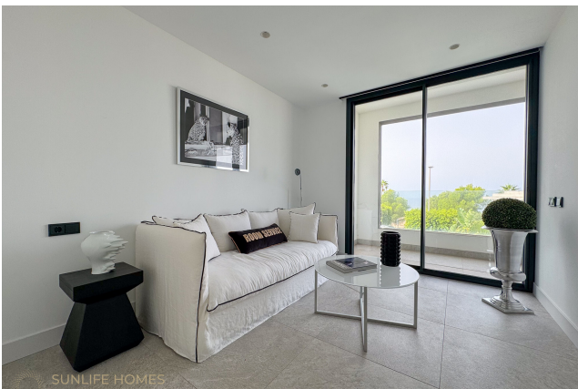
Villa Puig de Rós