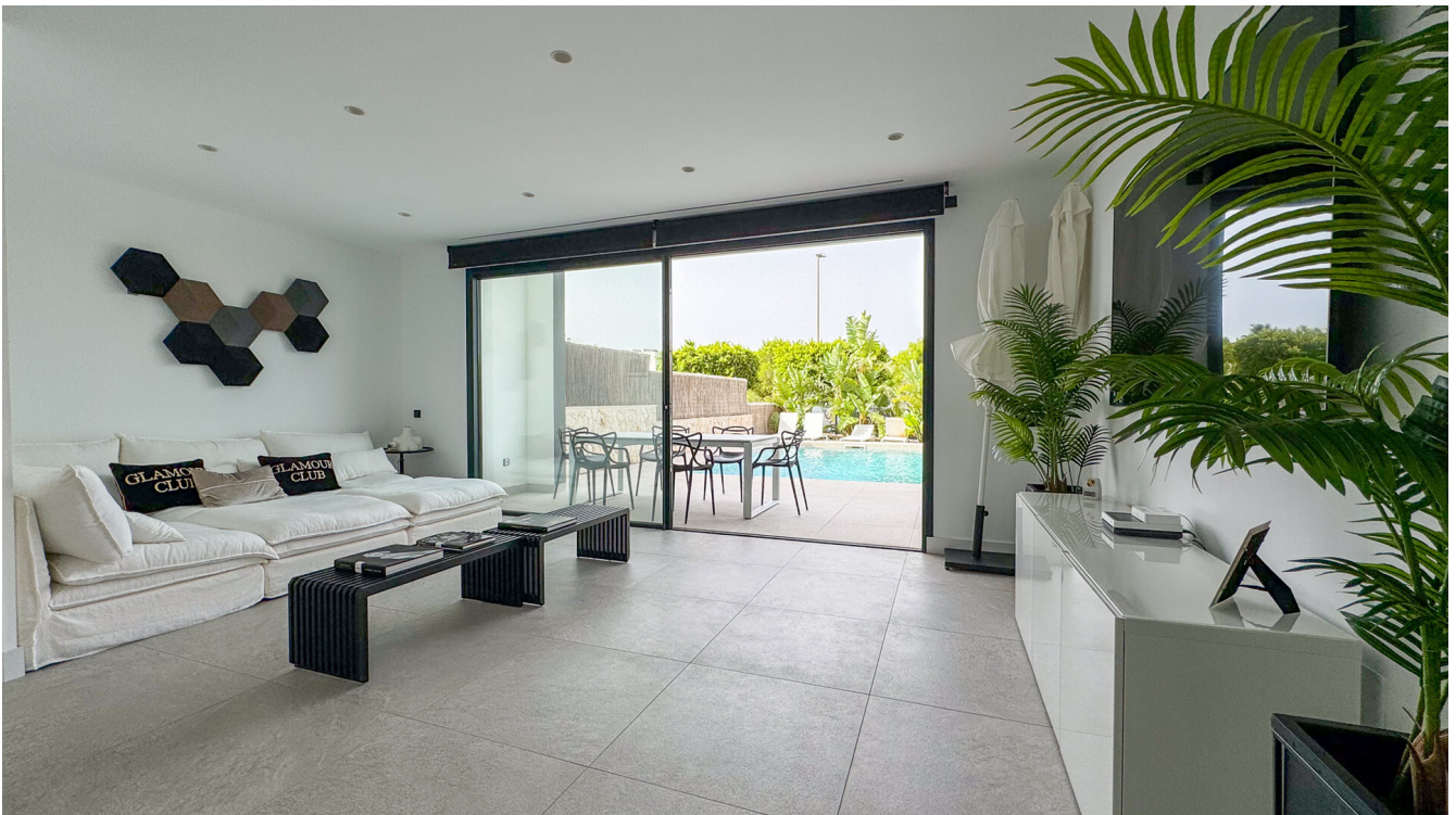
Villa Puig de Rós