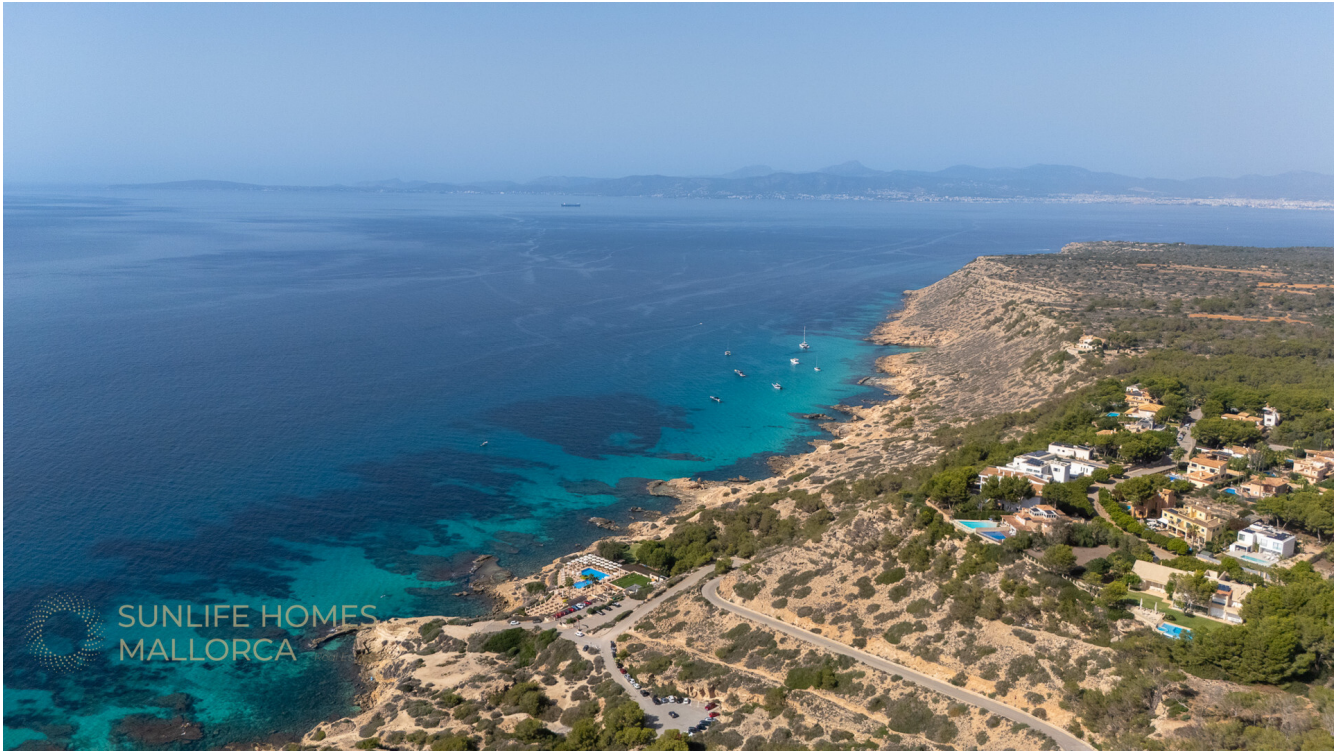
Villa Puig de Rós