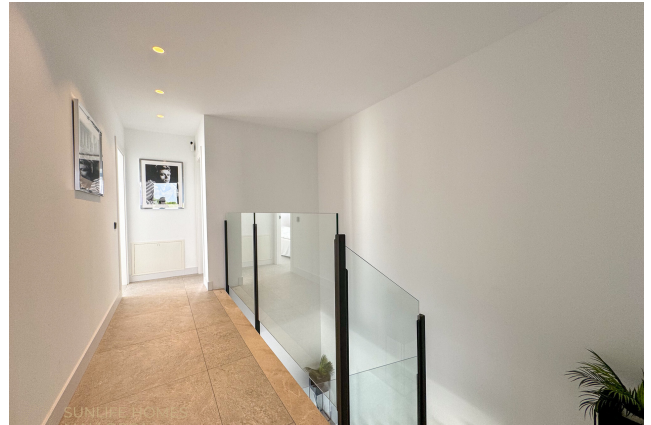
Villa Puig de Rós