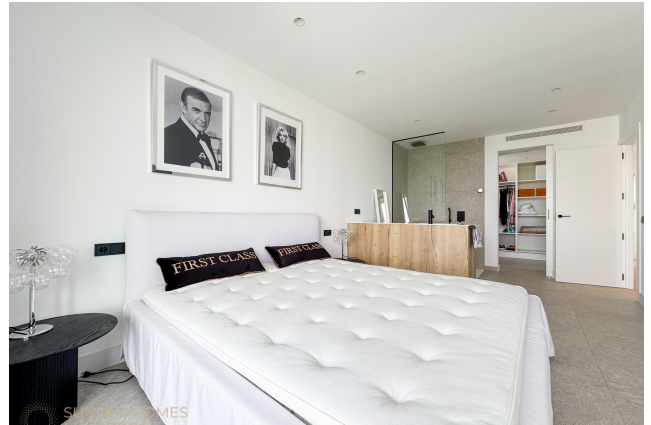
Villa Puig de Rós