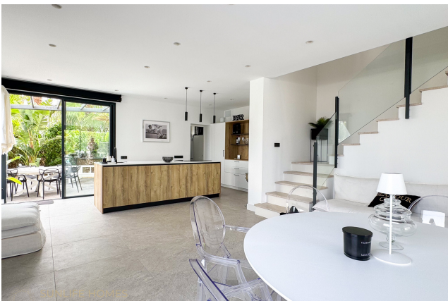
Villa Puig de Rós