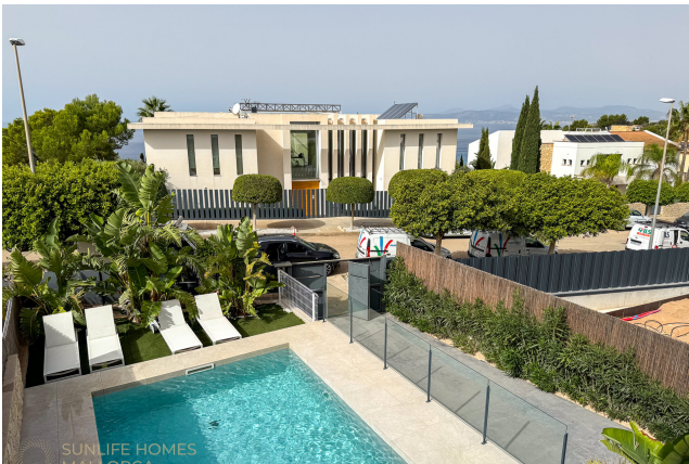
Villa Puig de Rós