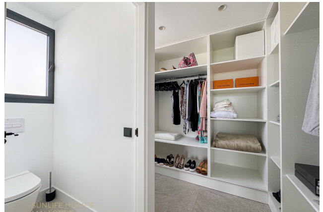
Villa Puig de Rós