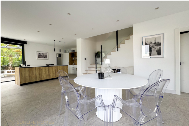
Villa Puig de Rós