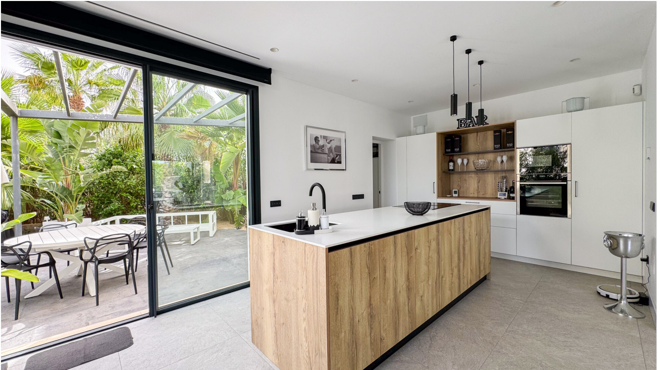
Villa Puig de Rós