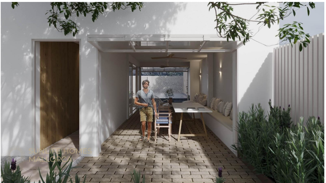
Stadthaus Pollença Mallorca