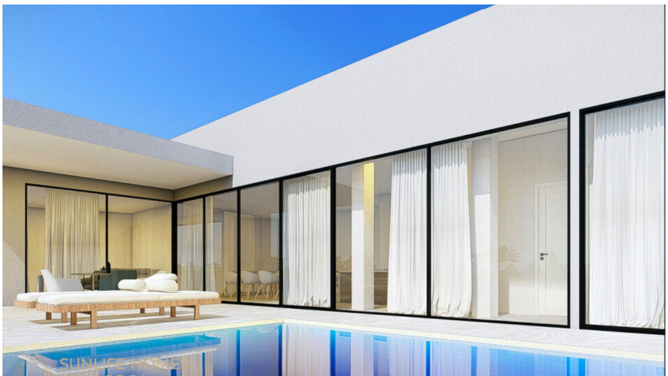
Großzügiger Poolbereich für entspanntes mediterranes Wohnen