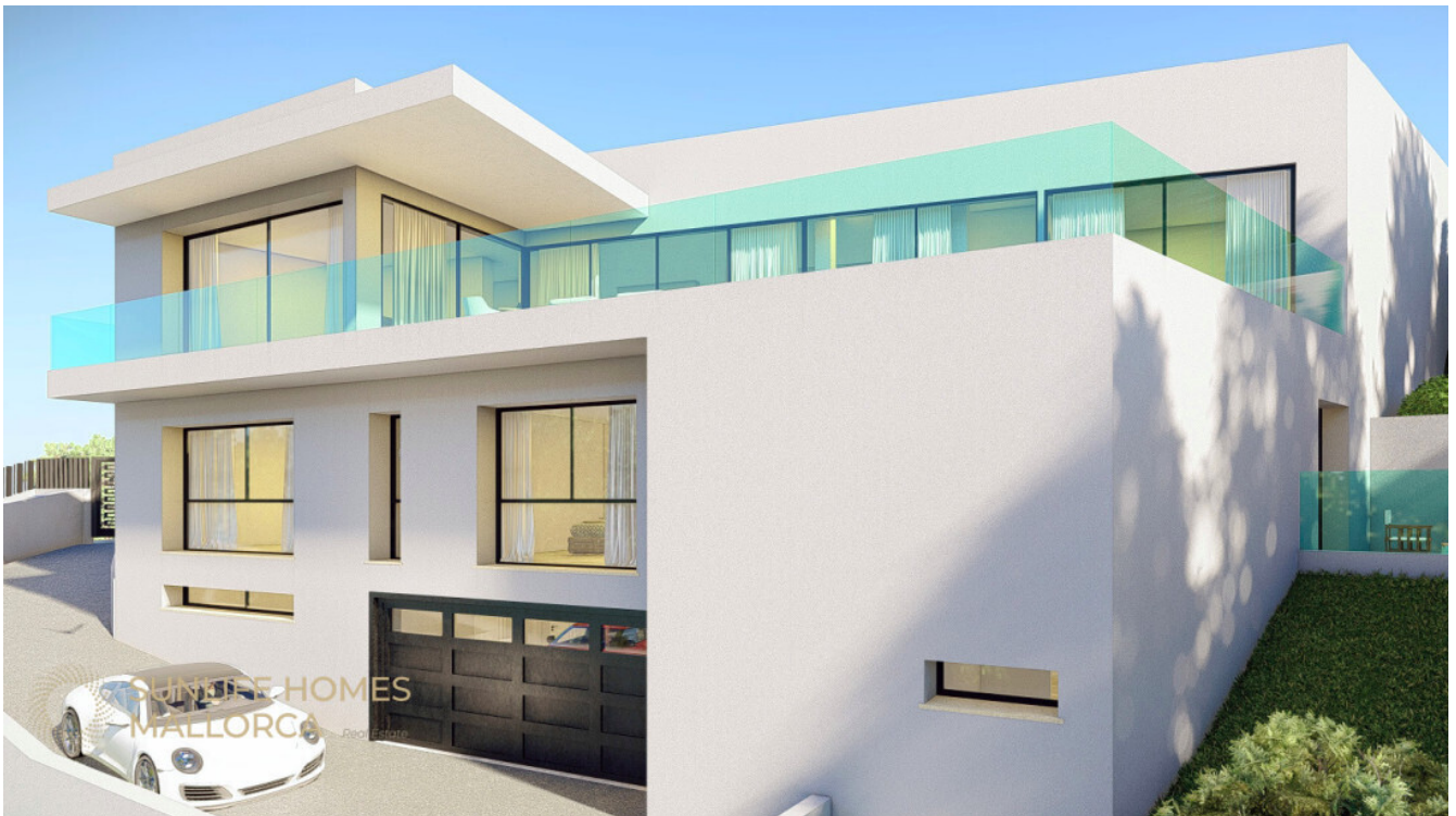
Architektonisch harmonisch integrierte Garage