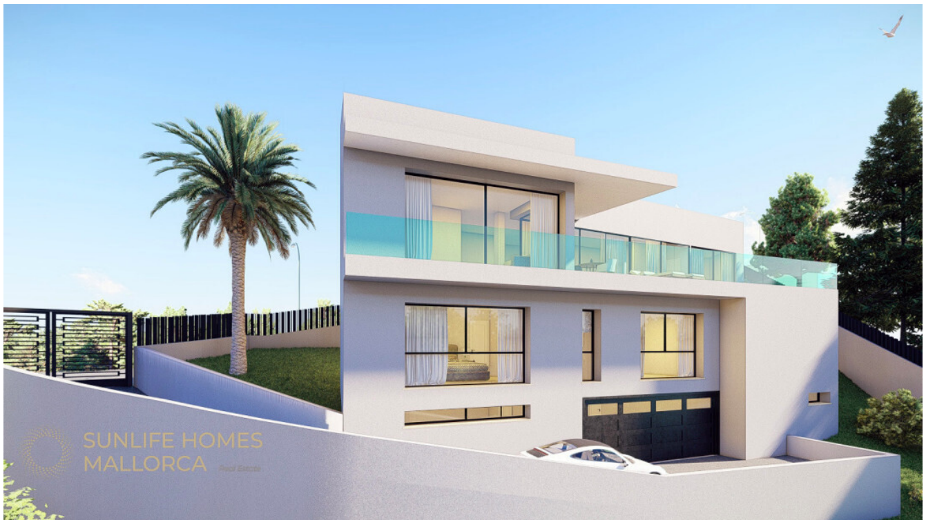
Zeitgemäße Architektur mit beeindruckender Linienführung