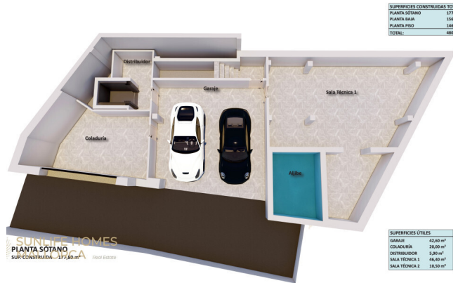
Grundriss – Level 1