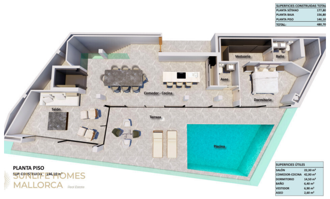
Grundriss – Level 3